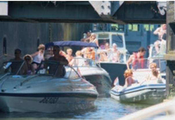
Op zomerse dagen zijn het de bruggen en sluisen die bij grote drukte als flessenhals gaan fungeren.

Bovendien is een boot een van de beste manieren om in contact met de in Nederland overgebleven natuur te komen. Gewoon lekker achter je anker, met geen ander geluid dan wat klotsend water, ruisend riet en ritselede populieren, terwijl om je boot heen de fuitjes en meerkoetjes scharrelen.