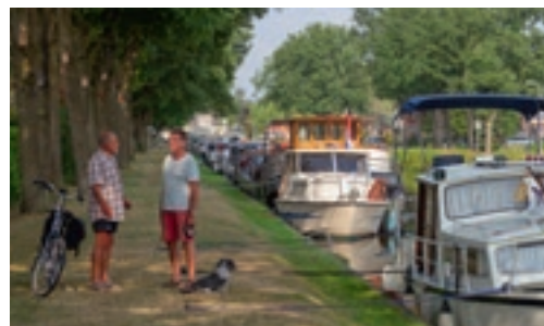
De aanlegplaats van Noordscheschut aan de Verlengde Hoogeveense Vaart ligt erg mooi.