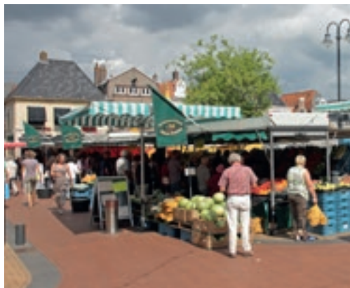
In Steenwijk is op zaterdag een drukbezochte markt.

Steenwijk is, als een van de grootste plaatsen in de Kop van Overijssel, een echt streekcentrum. De Markt is het centrale plein van het stadje; hier vind je terrassen en winkels. Rondom het centrum liggen stadswallen uit de Tachtigjarige Oorlog, toen vestingstad Steenwijk een belangrijke strategische functie had. Omdat de stad zeer vaak belegerd werd, is er verder uit die tijd niet veel meer bewaard gebleven.