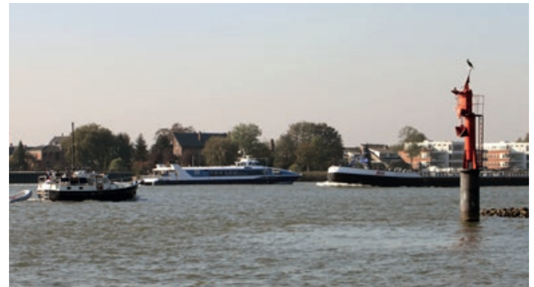
Beroepsvaart en pleziervaart kunnen behoorlijk in elkaars vaarwater zitten.

je eigen veiligheid, maar ook in het belang van de beroepsschipper, die hierdoor een veiligere, vlottere en zekerder vaart heeft. Deze ruimte kun je over het algemeen het beste