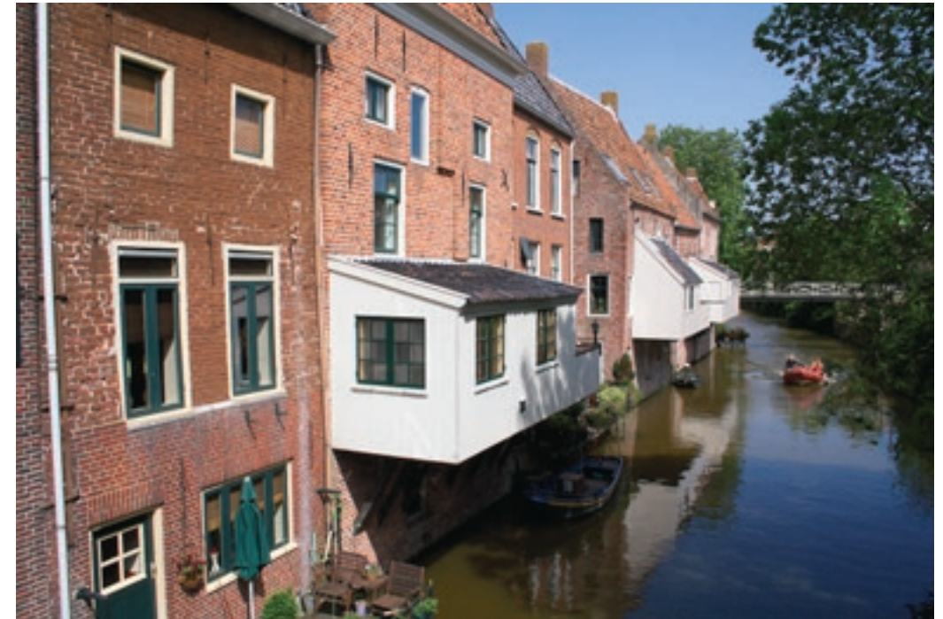
De beroemde keukens van Appingedam hangen boven het water omdat er in de woningen geen ruimte meer was.

Het Damsterdiep is direct overtuigend: mooi en lekker groen. Hoewel het Damsterdiep ooit gegraven is (oorspronkelijk heette het water Delf, hieraan ontleent Delfzijl zijn naam), waarschijnlijk nog voor het jaar 1000, zou je dat tegenwoordig niet meer zeggen. Vroeger stond het Damsterdiep in open verbinding met de zee en door de invloed van het getij is het water gaan meanderen.