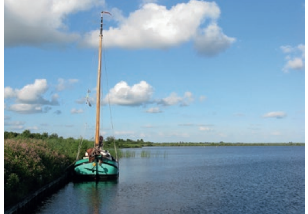
Rustige aanlegplaats op de Beulakerwijde.

Het Steenwijkerdiep loopt van Steenwijk naar de Wetering ter hoogte van Muggenbeet. Omdat alle bruggen beweegbaar zijn, kun je via deze vaart met staande mast over de Wetering en de Kalenbergergracht naar Ossenzijl varen.