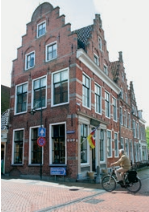
In Dokkum staan op veel plaatsen mooie oude panden.