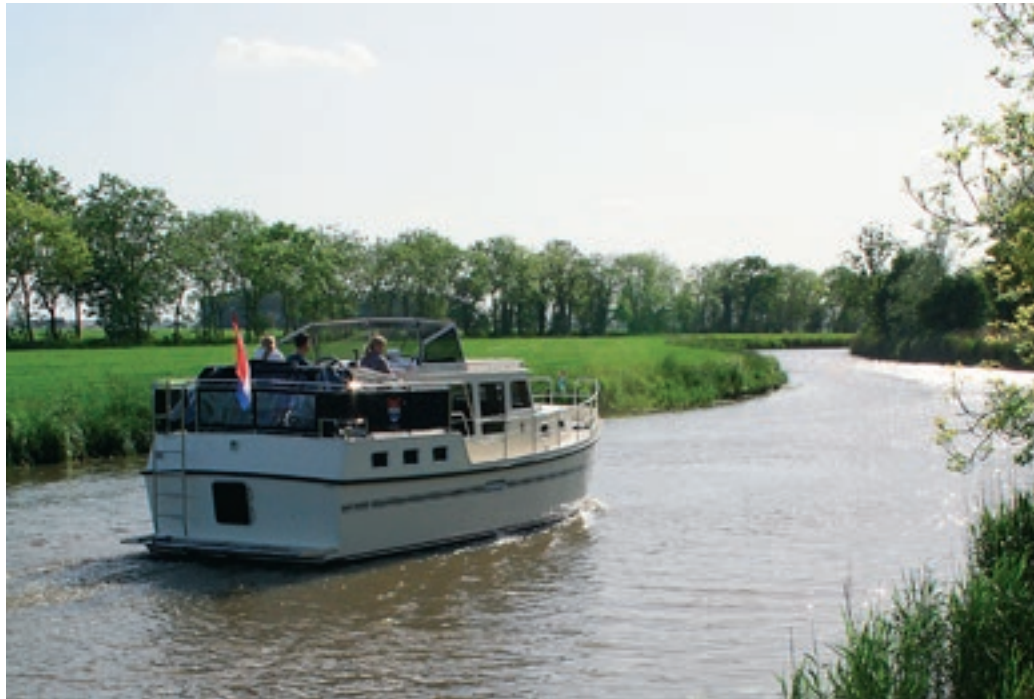
De slingers in het Damsterdiep maken het erg aantrekkelijk om hier te varen; bij elke bocht ben je nieuwsgierig naar wat er nu weer in het zicht zal komen.

Aansluiting op: Oude Eemskanaal (Delfzijl); Eemskanaal (via Groevesluis bij Appingedam); Westwijterwerdermaar; Eemskanaal bij Groningen Waterkaart: ANWB Waterkaart 2, Noord Groningen