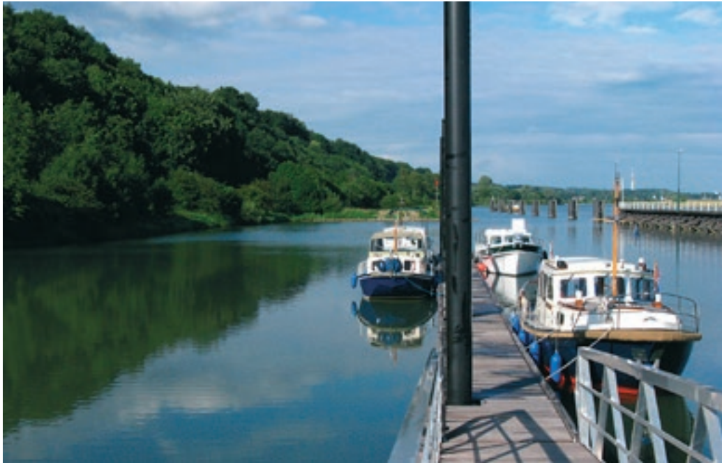
Vanaf de aanlegsteiger boven de stuw in Driel zijn mooie boswandelingen mogelijk.

gestreken zijn moet de scheepvaart schutten in de schutsluis. Dit wordt aangegeven met lichten of pijlen. In de zomerperiode is de vaart richting stuw onmogelijk gemaakt door betonning.