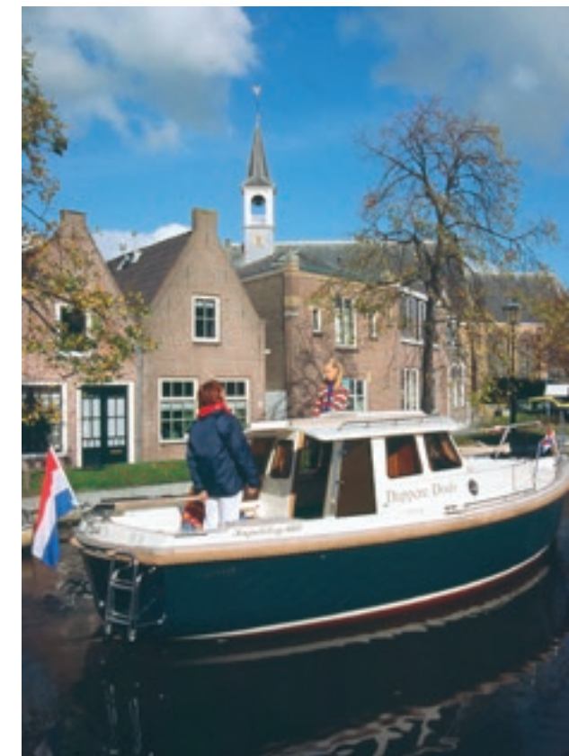
Varend langs het 'beschermde dorpsgezicht' van Schipluiden.

Niet alleen ligt het tempo op het water vele kilometers per uur lager, waardoor nuances beter doordringen, maar ook is Nederland vanaf het water gezien gewoon zoveel mooier. Want dankzij het water is Nederland zoals het is – als gevolg van inpoldering of juist afgraving, of van nature, want tot de komst van de auto ging het meeste vervoer over water. Dorpen en steden, zelfs hele landschappen, werden ingericht rondom het (vaar)water. En daar waar die oude vaarwateren nog liggen (gelukkig nog op vele plaatsen), blijkt in de loop van de eeuwen eigenlijk niet zo heel veel veranderd. Nog steeds ligt vaak het mooiste gezicht van een nederzetting naar het water en zorgen rietkragen en treurwilgen voor een passende omlijsting. Niet alleen zijn in alle provincies de mooiste en zeer afwisselende vaarwateren te vinden, alle provinciehoofdsteden zijn ook nog eens vanaf het water bereikbaar. En daarnaast vele tientallen andere dorpen en steden, zodat je vanaf je eigen drijvende huisje een onbekende plaats kunt aandoen, een terrasje kunt pikken of uit eten kunt gaan en dan weer aan boord overnachten.